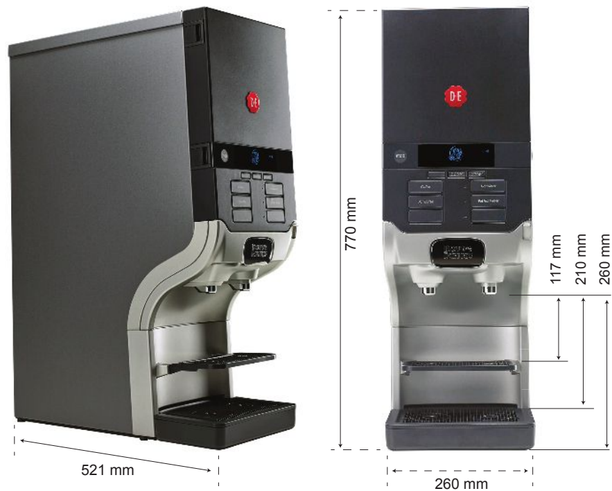
Cafitesse Quantum 110